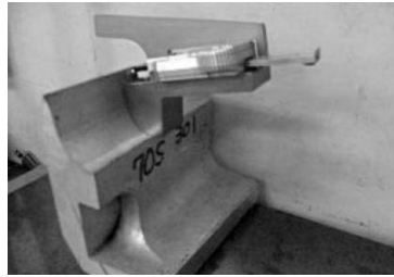
HDP-8 BDW 50N70S-22R-1/5-50