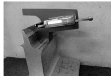
HDP-8 BKW 50N70S-13R-1/5-50