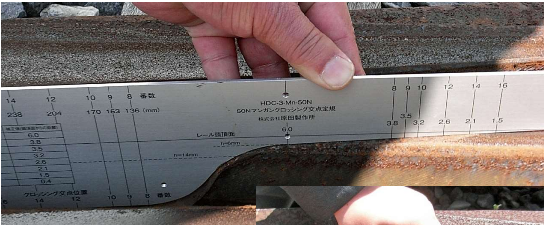
マンガクロッシング

本器は各種マンガクロッシングのクロッシング交点、あるいは交点の位置と摩耗測定位置（番数 x 17）を表示した定規です。定規は、ノーズ先端の削正形状を基に製作され、クロッシング交点、クロッシング摩耗測定位置を容易に確認することができます。